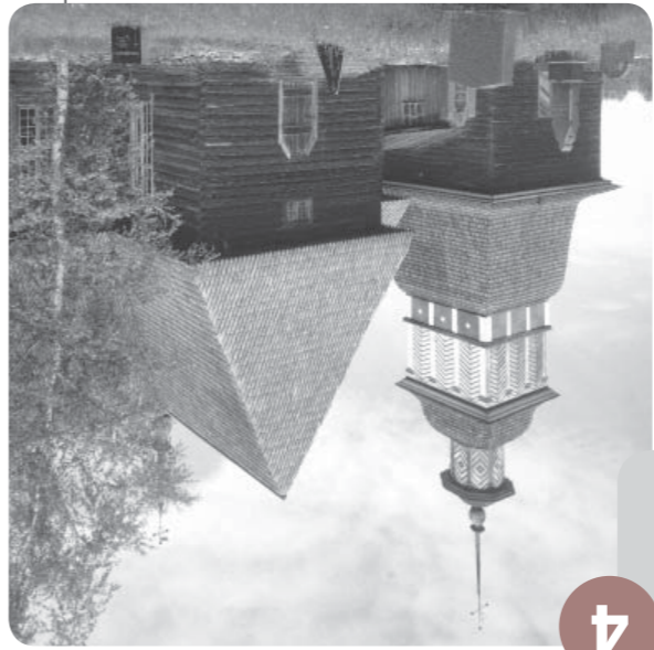
PETÄJÄVEDEN VANHA KIRKKO